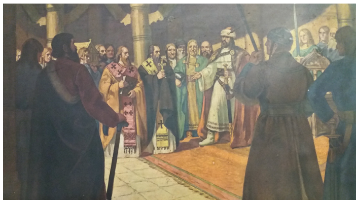
Privítanie sv. Cyrila a sv. Metoda na hrade Devín kniežatom Rastislavom (pred r. 1935)