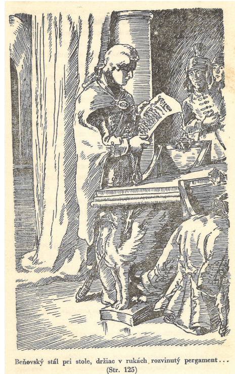
Beňovský stál pri stole, držiace v rukách rozvinutý pergament... (Str. 125)