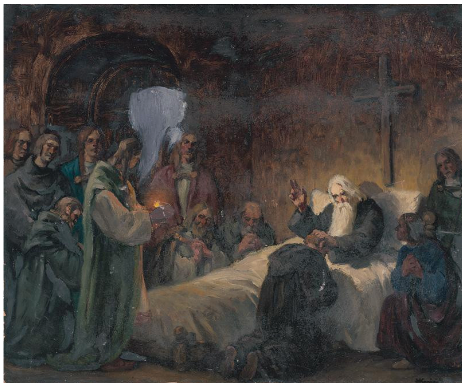
Štúdia k obrazu kráľ Svätopluk sa lúči so svojimi synmi (okolo 1940)