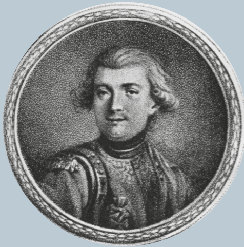
Móríc Beňovský / Benyovszky Móríc