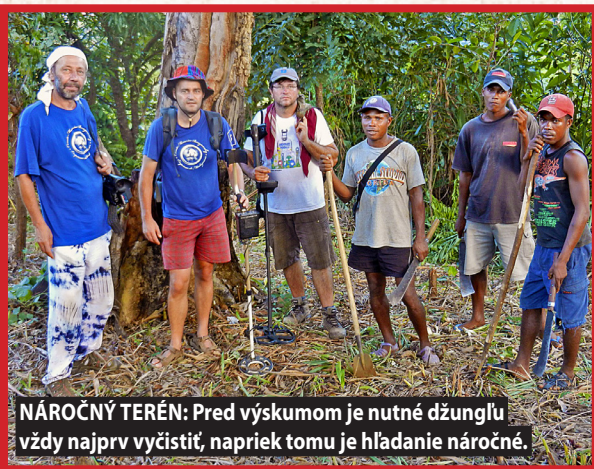
NÁROČNÝ TERÉN: Pred výskumom je nutné džunglu vždy najprv vyčistiť, napriek tomu je hľadanie náročné.