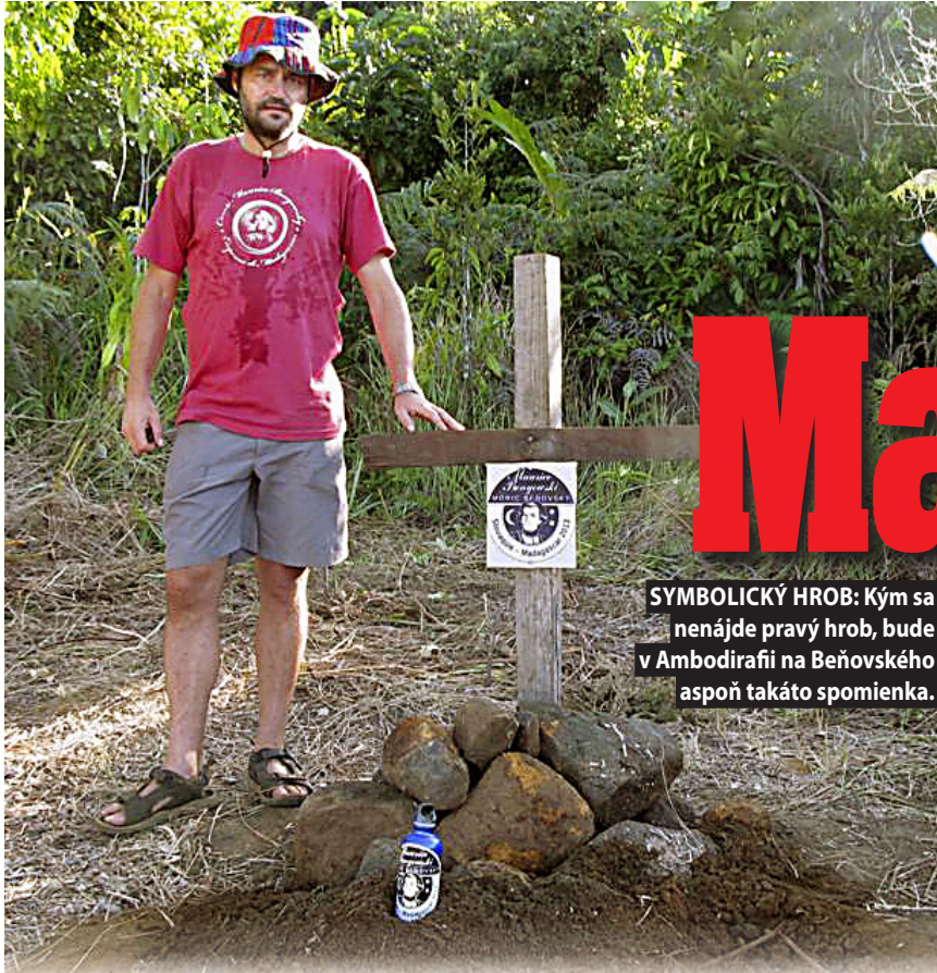
SYMBOLICKÝ HROB: Kým sa nenájde pravý hrob, bude v Ambodirafi na Beňovského aspoň takáto spomienka.