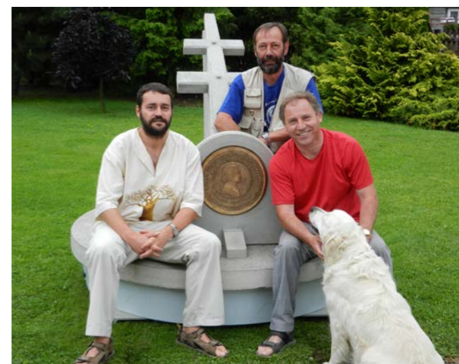
POMNÍK. Kousek Slovenska na severním Madagaskaru. V městě Antalaha stojí Beňovského pomník v podobě plachetnice se stěžněm ve tvaru slovenského dvojramenného kříže.

Když se koncem roku 1772 dotrhl do Paříže, dostalo se mu slyšení u francouzského krále Ludvíka XV.,