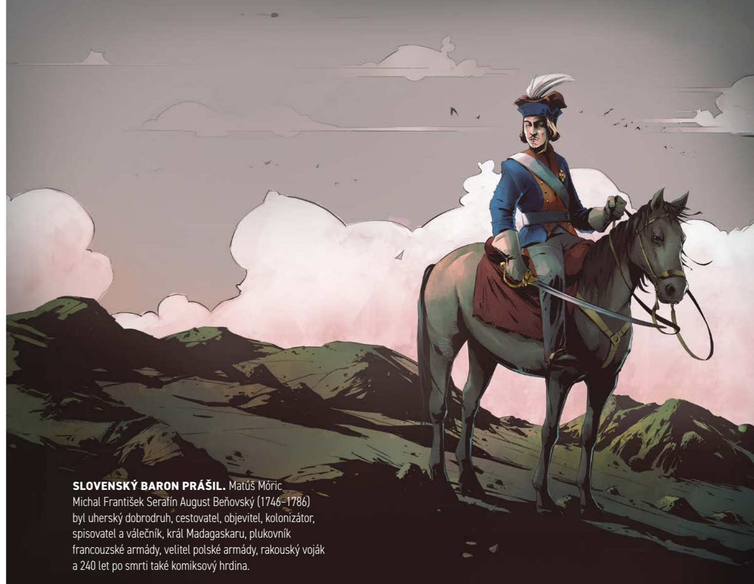
SLOVENSKÝ BARON PRÁŠIL. Matúš Móric Michal František Serafín August Beňovský (1746–1786) byl uherský dobrodruh, cestovatel, objevitel, kolonizátor, spisovatel a válečník, král Madagaskaru, plukovník francouzské armády, velitel polské armády, rakouský voják a 240 let po smrti také komiksový hrdina.

Ani tam se akční mladík nevzdal. Ač mu bylo teprve lehce nad dvacet, stal se vůdcem vzbouřenců, kterým se podařilo ukrást loď Svatý Petr a Pavel . Na této bádce, jež nebyla stavěna pro plavbu po širém oceánu, nezkušené